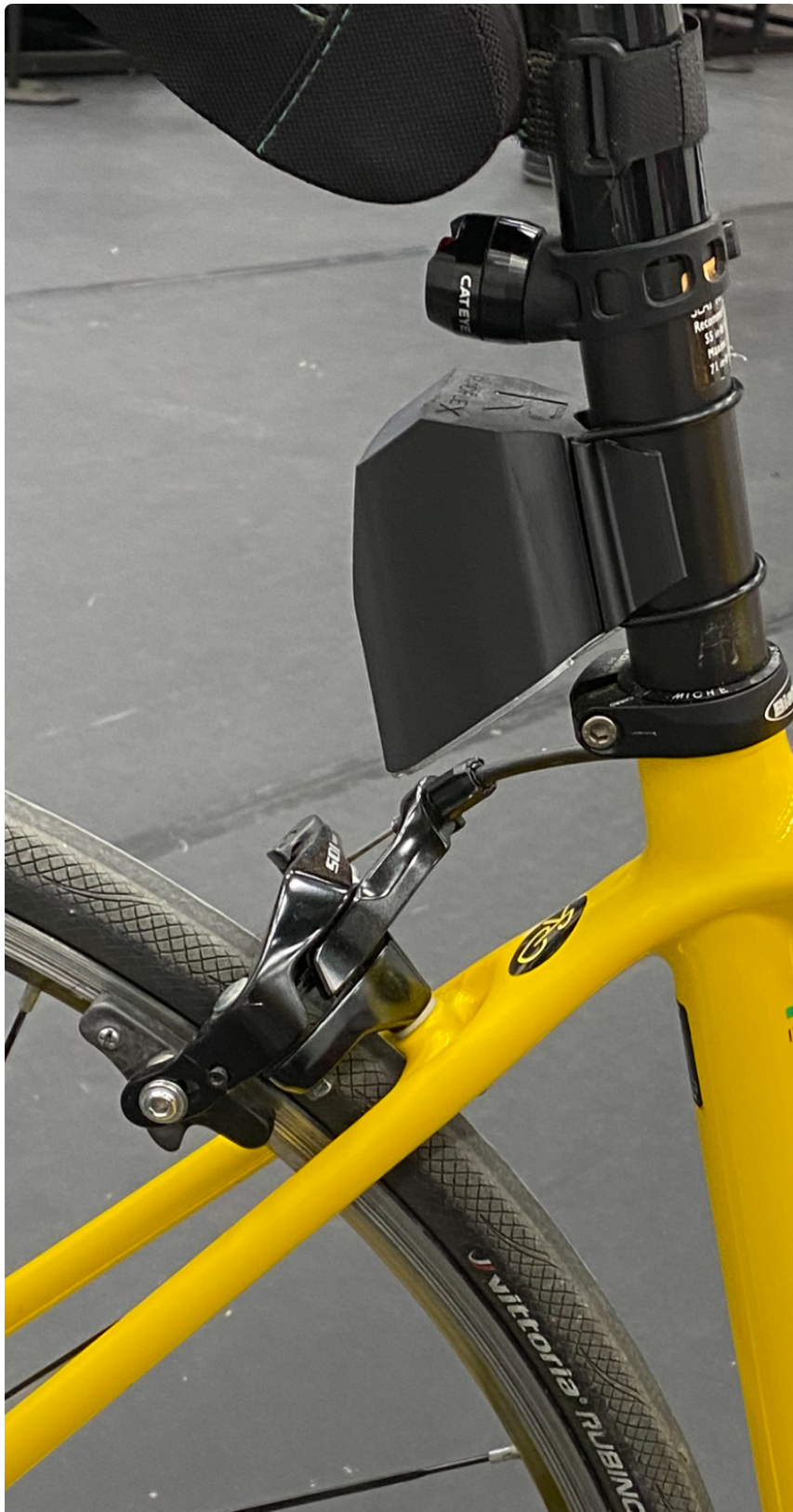
Team Rynkeby cykel med Radflex BRR radarreflektor monterad